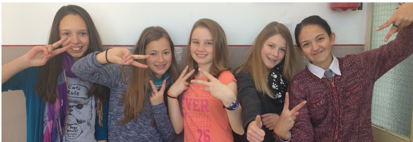
Az újság elkészítésében szorgoskodók: V. B, VI. A, VII. A, VII. B és VIII. A osztályok tanulói. A karácsonyi pályázat szervezői: VIII. B osztály.