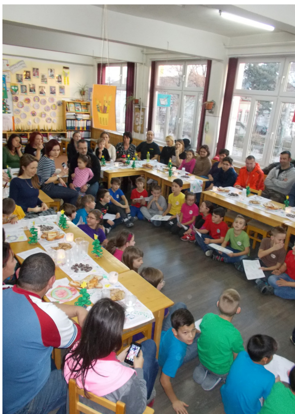
Ami az asztalra kerül, mind a mi munkánk.